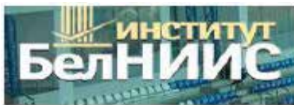
BELNIIS - Belorusija